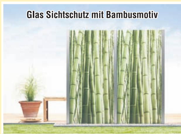
Glas Sichtschutz mit Bambusmotiv