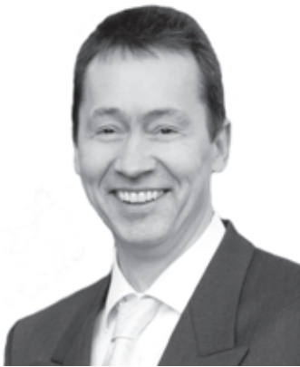
von Jens Veit Günther*

Schon 2018 soll es laut durchgesickerten Gerüchten in der Europäischen Union kein Bargeld mehr geben. Ganz weit dürfte dieses Gerücht nicht von der Wahrheit entfernt sein. In der Bevölkerung wird bereits medial der Boden für die Abschaffung des Bargeldes bereitet. Die Abschaffung des Bargelds ist ein gemeinsamer Traum von Banken und Staaten. Der Banken, weil sie durch Gebühren für Kartenzahlungen mehr verdienen. Der Staaten, weil die elektronischen Geldflüsse hervorragende Überwachungsmöglichkeiten bieten. Es ist ein globaler Trend: statt mit Bargeld, zahlen immer mehr Menschen mit Kreditkarte oder online per Smartphone. Dieser Trend hat System. Vorreiter dieser Entwicklung ist Schweden. Aber auch in den USA hat sich eine Kreditkartenschwemme durchgesetzt. In zahlreichen Staaten wurde die Summe des in bar abhebbaren Geldes beschränkt. In Schweden haben bereits einige Bankfilialen die Auszahlung